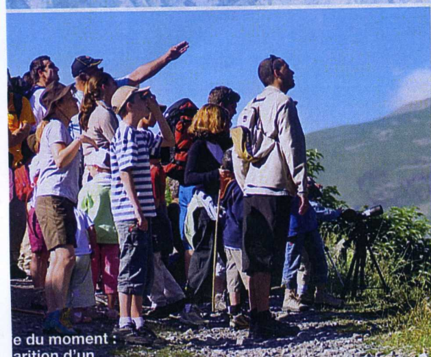
du moment : arition d'un uetin... ou d'un nois ?

Mais ce n'est pas une montagne plan-plan pour autant. Vos ados « kifferont » les via ferrata, le VTT ou l'escalade avec les Guides et accompagnateurs de montagne ! Et pour ce qui est de ce charmant village, l'été, les animations foisonnent et vous pourrez en profiter pleinement : fête de l'Âne, du patrimoine, sculptures de paille et de foin. Parions que cela va vous... botter !