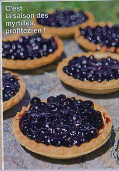
C'est la saison des myrtilles, profitez-en !