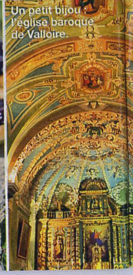
Un petit bijou : l'église baroque de Valloire.